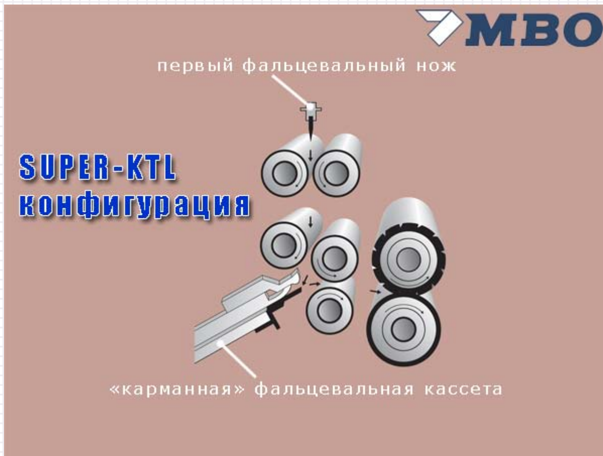
конфигурация системы SUPER-KTZ (MBO K66)