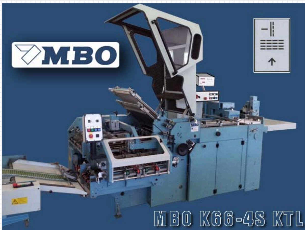
Комбинированная кассетно-ножевая фальцевальная машина MBO K66-4S KTL

Комбинированная кассетно-ножевая фальцевальная машина MBO K66-4S KTL. Может выполнять до четырех фальцев в кассетах а также два ножевых фальца, тем самым делая до трех перпендикулярных фальцев. Чаще всего используется для производства книжно-журнальной продукции.