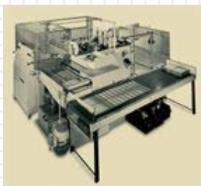
Kolbus DA.S 36

Первый оригинальный Kolbus DA 36 был выпущен в 1967 году. В общей сложности было построено 1.218 машин, прежде чем модель была обновлена в 1995 году. Производство машин большего формата DAS 36 было начато в 1976. Последняя машина семейства DA с заводским номером 208 сошла с конвейера в 2004 году.