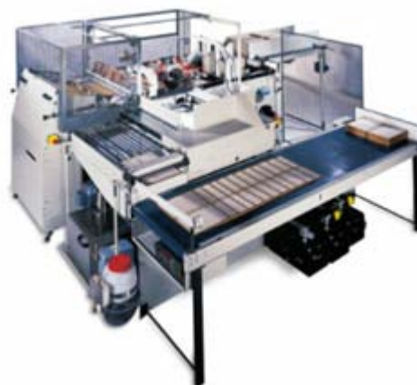
Kolbus DA.S 36

Крышкоделательная машина Kolbus DA-36 с листовой подачей переплётного материала служит для изготовления переплётных крышек. Процесс изготовления заключается в соединении картонных штукоек (сторонек) и отстава с крающим материалом.